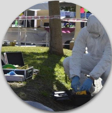
Muestreo de campo