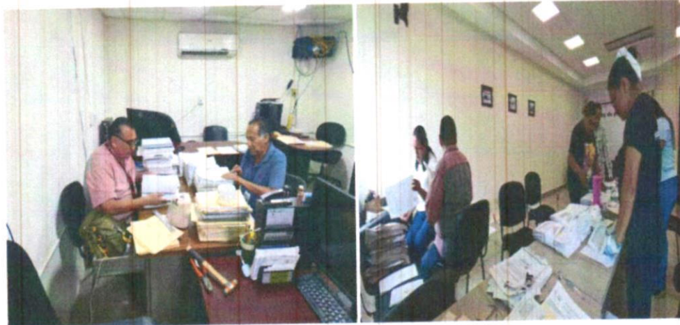
Asesorías en materia de organización de Archivo a las distintas áreas de la Fiscalía General del Estado de Tabasco