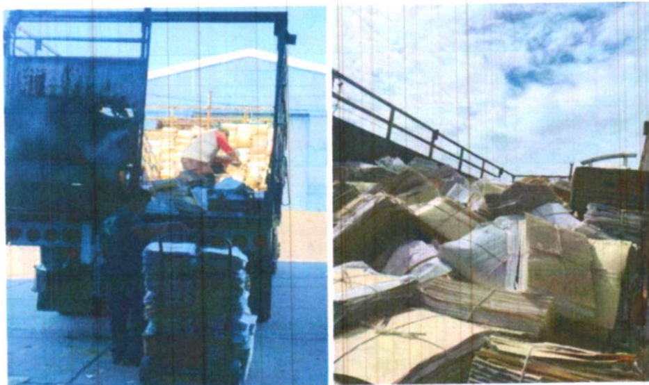
Bajas documentales 2025