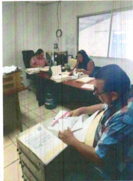
Revisión de transferencias primarias 2025