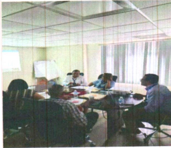
Sesiones del Grupo Interdisciplinario de Archivos