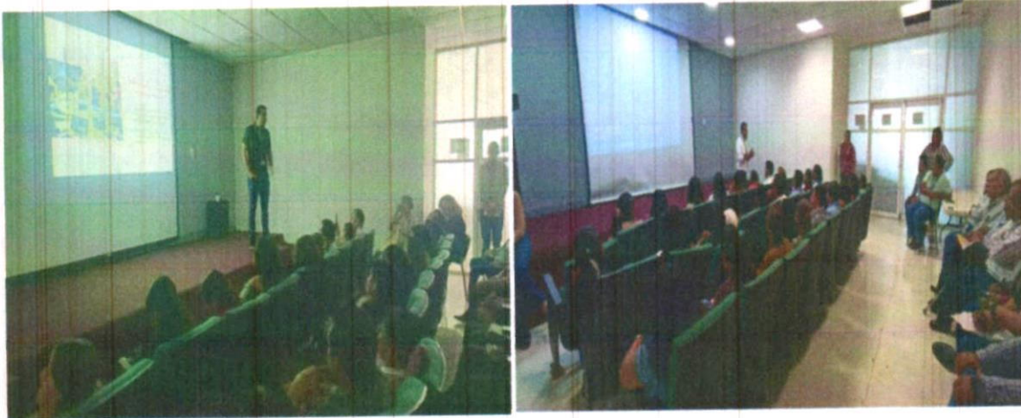
Capacitaciones en materia de Archivo 2025