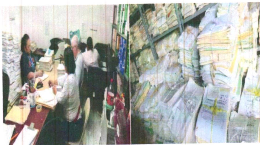
Digitalización de expedientes semiactivos