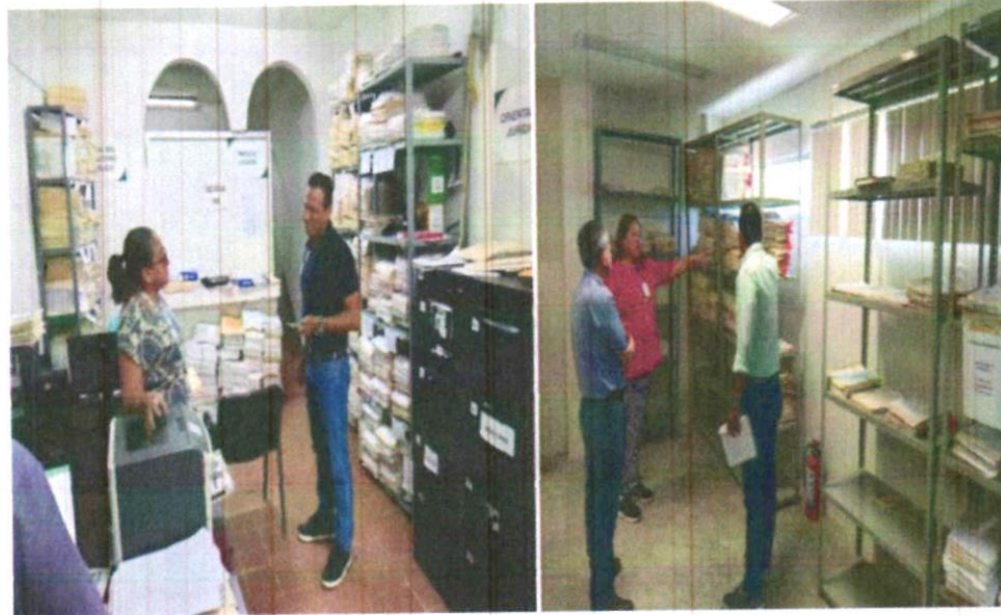
Visitas de Supervisión al Centro de Procuración de Justicia de Tecolutilla (izq.) y al Centro de Procuración de Justicia de Tenosique (Der).

Las supervisiones archivísticas permitieron identificar áreas de oportunidad, corregir desviaciones en la organización documental y reforzar el cumplimiento normativo, contribuyendo a una gestión documental más eficiente y homogénea en la institución.